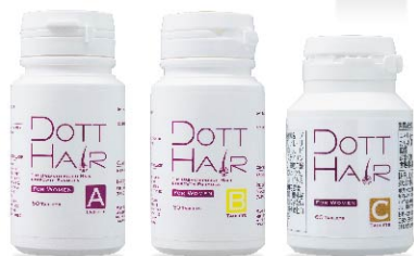
ドットヘア For Women タブレット (1ヶ月分/箱)